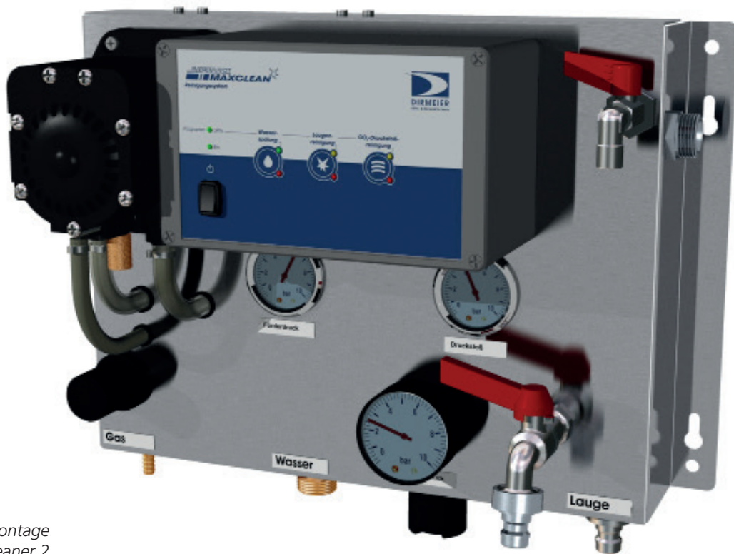
Wandmontage Max Cleaner 2